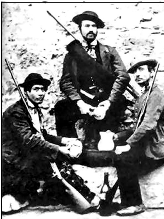
ESPONENTI DELLA COSCA DI CASTIGLIONI MENTRE SI RIPOSANO DOPO UN'OPERAZIONE

verde, visto e considerato che il fido Bonaventura è un tifoso convinto, non a caso . . . comunque questo matrimonio gli è stato detto "non s'ha da fare"